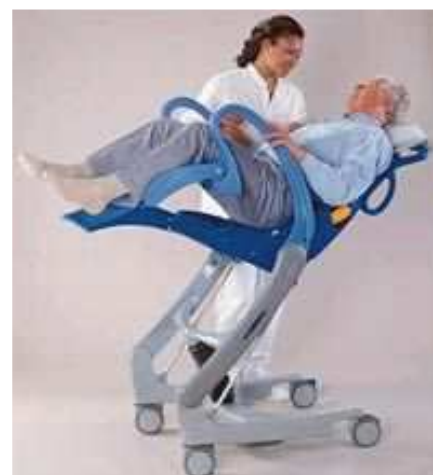
Le Carendo en situation