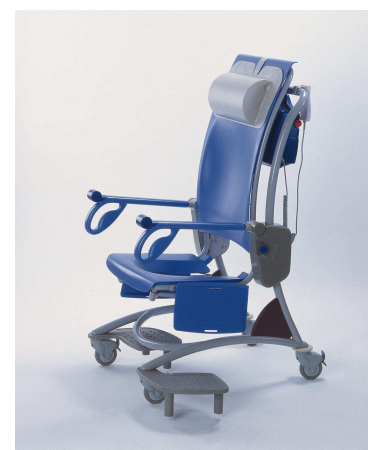
Fauteuil électrique de douche CARINO