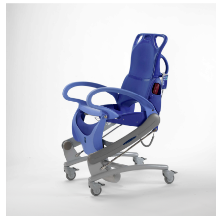
Fauteuil électrique de douche CARENDO